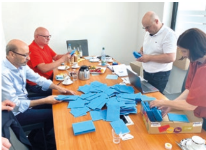
Wahlvorstand bei der Auszählung der Stimmzettel

Wenn für eine Fachrichtung keine gültige Stimme vorliegt, dann gibt es für diese Fachrichtung keinen Vertreter. Die Wahl ist in diesem Fall dennoch gültig (§ 6 Abs. 3 Wahlordnung).