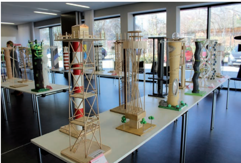
Modelle des diesjährigen Schülerwettbewerbs Junior.ING