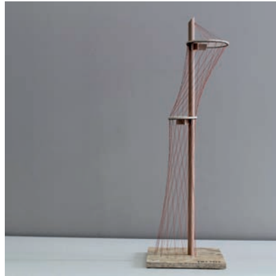
Siegermodell Alterskategorie I „Himmelstör“