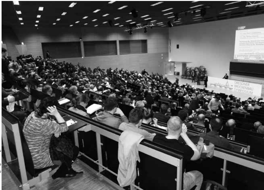
Dr. Wolfgang Ellinger

Der Tradition entsprechend wurde der Preis im Hörsaalzentrum Auditorium Maximum in den beiden Kategorien „Straßen- und Eisenbahnbrücken“ und „Fuß- und Radwegbrücken“ mit im Voraus festgelegten jeweils drei Nominierungen vergeben. Die Vergabe für geistig-kreative Ingenieurleistungen in der Königsdisziplin des Bauwesens erfolgte durch den Präsidenten der Bundesingenieurkammer (Blngk) und den Präsidenten des Verbandes Beratender Ingenieure (VBI). Vor Beginn der Veranstaltung erfolgte im Foyer und den Nebenräumen die Eröffnung einer beeindruckenden Fachmesse des Brückenbaus mit verschiedenen Exponaten dieser Sparte.