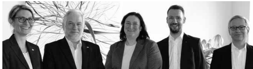
Die Fachjury des diesjährigen Schülerwettbewerbs.

Auf einer quadratischen Bodenplatte (40 cm x 40 cm) musste eine Tribüne (deren Bau und Gestaltung freigestellt war)