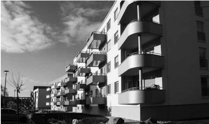
Die „Projektscheune“ realisierte die Generalplanung des Objektes.

Die modernen Anforderungen an den Wohn- und Gesellschaftsbau stellen unsere Generation aufgrund des fortschreitenden demografischen Wandels vor eine gewaltige Aufgabe. Angesichts dieser Entwicklung ist eine wachsende Nachfrage nach barrierefreien Wohnungen für Senioren festzustellen. In den 90-er Jahren wurden in großem Umfang Modernisierungsmaßnahmen an den Plattenbauten in den neuen Bundesländern durchgeführt. Dabei wurde die Chance, die erforderlichen Wohnanpassungs- und Umgestaltungsmaßnahmen entsprechend des Bedarfs zu entwickeln, nur in Ausnahmefällen genutzt. Die Mehrzahl der vorhandenen Wohngebäude erfüllt häufig nicht die Anforderungen nach einer altersgerechten Gestaltung. Aus diesem Grund wird gegenwärtig eine barrierefreie Umwandlung von vorhandenen Bauten angestrebt. Dabei ist die Wirtschaftlichkeit der jeweiligen Baumaßnahme und der Gebrauchswert der Altbausubstanz zu berücksichtigen und zu bewerten. Nicht zu vernachlässigen ist der energietechnische Aspekt, denn die unsanierten Bauwerke werden bekanntermaßen als „verwahrloste Energiefresser“ betitelt.