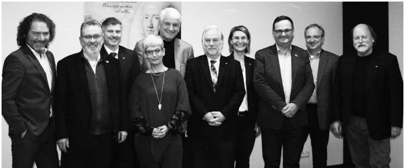
Vorstand und Geschäftsführung der Ingenieurkammer Thüringen

Am 19. und 20. Februar 2016 fand in Jena die jährliche Vorstandsklausur statt.