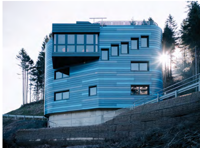
Trainer- und Sprungrichterturm Ansicht Talseite

Im Zuge der Generalsanierung der Skisprungsportstätten im Thüringer Wintersportzentrum Oberhof ließ der Zweckverband als Bauherr im Kanzlersgrund Oberhof in den Jahren 2017/2018 ein neues Funktionsgebäude für die Schanzen HS100 und HS140 - einen Trainer- und Sprungrichterturm - errichten. Mit dem Neubau konnte die für Training und Wettkampf erforderliche Blickbeziehung der Trainer und Sprungrichter zu den Sportlern von der Absprungkante bis zur Landung gewährleistet werden.