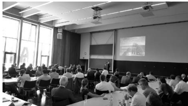
Viele interessierte Akteure entlang der Wertschöpfungskette Bau informierten sich zu BIM auf dem Innovationsforum Bauen 4.0 in Mainz.

schulen bei der Digitalisierung des Bauwesens zu wirken, den Wissensaustausch bis hin zu konkreten Projekten auf Basis regionaler Eigeninitiative voranzubringen. Dies wird über mehrere Veranstaltungen in Kooperation mit regionalen Clustern geschehen. Zu einem gemeinsamen Regionalforum luden die Förderinitiative