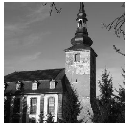
Preisträger 2011: Kirche St. Maritius und Andreas zu Kleinneuhäusen