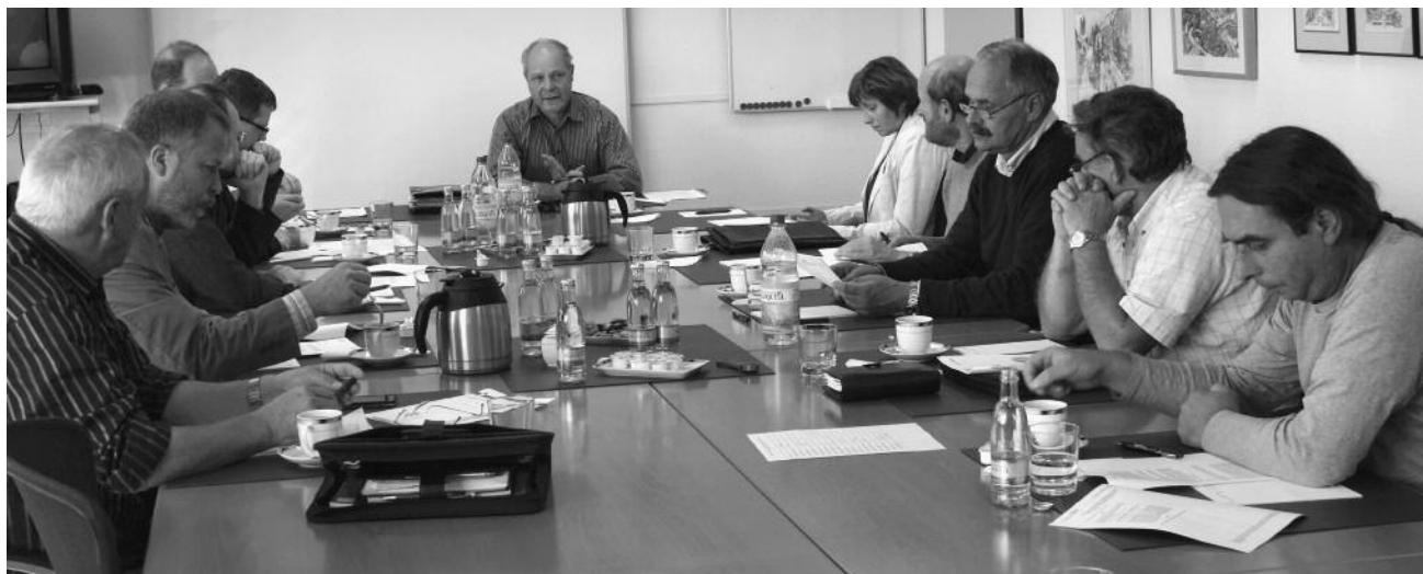
Mitglieder des Arbeitskreises

Aktuelle Informationen und Terminhinweise finden Sie unter www.ikth.de unter „Aktuelles“