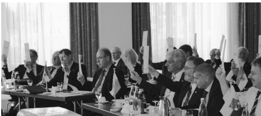
Die Präsidenten und Delegierten der Länderkammern bei der Abstimmung.