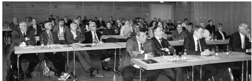
Fachpublikum im Carl-Zeiss-Saal der Messe Erfurt.