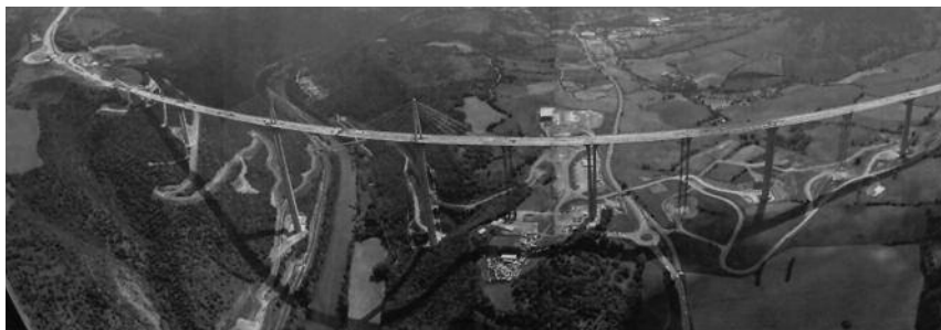
Brücke von Millau

Zu diesem Thema wurde schon viel veröffentlicht und in zahlreichen Beratungen diskutiert. Der Begriff wird schon sehr inflationär verwendet. Im Ergebnis vorliegender Recherchen und Unterlagen erfolgte in den Vorträgen und Gesprächen eine Bilanz des Erreichten und welche Aufgaben unmittelbar zu lösen sind, um die eigentliche Zielstellung schrittweise zu erfüllen. Unter nachhaltigen Gebäuden können nach den verschiedensten Kriterien nur optimierte Gebäude verstanden werden.