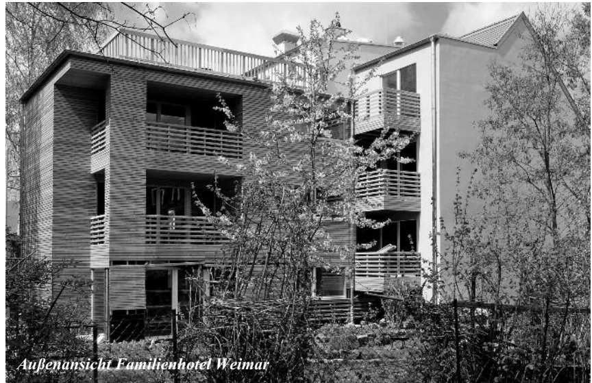
Außenansicht Familienhotel Weimar

Frau Dipl.-Ing. Bettina Hahn, Ingenieurbüro für Konstruktion und Statik und Mitglied der Ingenieurkammer Thüringen, kommentierte die Besonderheiten des Bauvorhabens folgendermaßen: „Eine Herausforderung in der Planung war die beengte Lage im innerstädtischen Raum mit angrenzender Bebauung und Höhensprüngen im Gelände. Die teilweise schlechten Baugrundverhältnisse unter der Grundfläche des Gebäudes, die versetzten Etagen mit unterschiedlichen Gründungstiefen und die notwendige Umbauung des denkmalgeschützten Gewölbekellers waren weitere Punkte, die in statischer und konstruktiver Hinsicht eine große Rolle spielten. Wir haben uns in enger Zusammenarbeit mit einem Grundbauingenieur für zwei verschiedene