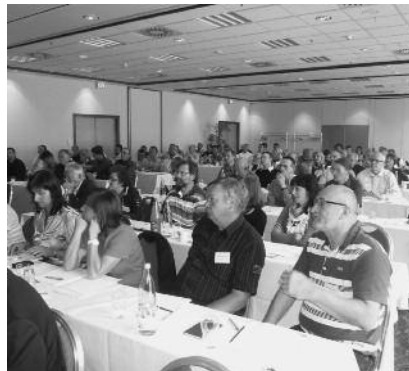
Interessierte Zuhörer im Tagungsraum des Penta Hotels.

Weitere Vorträge beschäftigten sich mit den Themen „Gesamtschuldnerische Haftung“