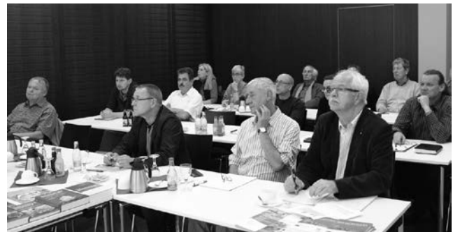
After-Work-Veranstaltung der IKT und AKT zu „Anforderungen und Haftungsrisiken bei Abbruchmaßnahmen“ im ThEx

notwendig, was mit großen Risiken für Ingenieure und Architekten, aber auch für Bauherren und Sachverständige behaftet ist.