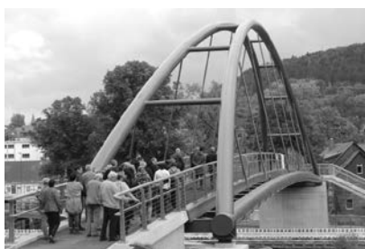
Dipl.-Ing. Kleb informierte die Gäste an der Fußgängerbrücke.

Nach zehnjähriger Planungszeit begann im Juni 2016 der Bau. Dieser umfasste den Neubau als Stabbogenbrücke einschließlich der erforderlichen Rampen- und Treppenanlage in Stahl- und Stahlbetonbauweise. Das Brückenbauwerk überspannt die Gleisanlage der Deutschen Bahn im Bahnhofsbereich, ca. 80 Meter östlich des Bahnhofsgebäudes. Die nördliche Zuwegung zum Brückenbauwerk ist durch einen Geh-/Radweg realisiert, der auf einem Damm an das nördliche Widerlager heranführt. Die südliche Zuwegung der Brücke erfolgt in Höhe des Geh-/Radweges, süd-